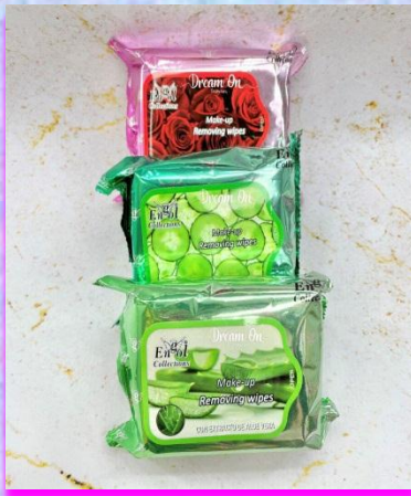
Toallitas desmaquillantes Engol x 30 $ 6.000