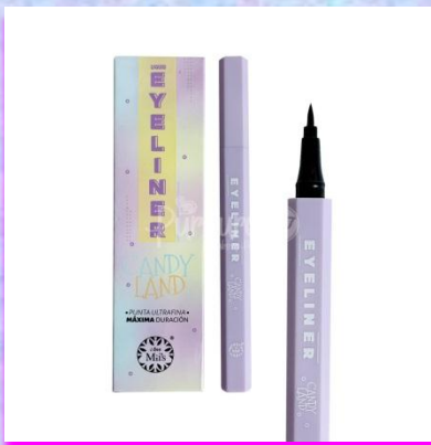
Delineador en plumón Miis Cosmetics Candy Land Con punta delgada para más precisión en el trazo