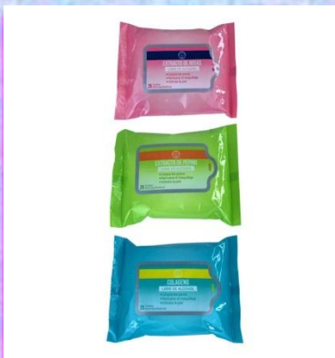
Toallitas desmaquillantes Miis x 25 $ 6.000