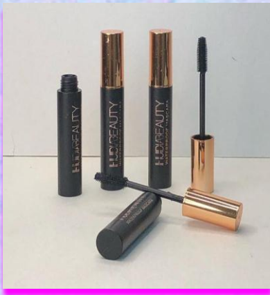
Pestañina Hudiabeauty Cerdas de silicona para alargar tus pestañas.