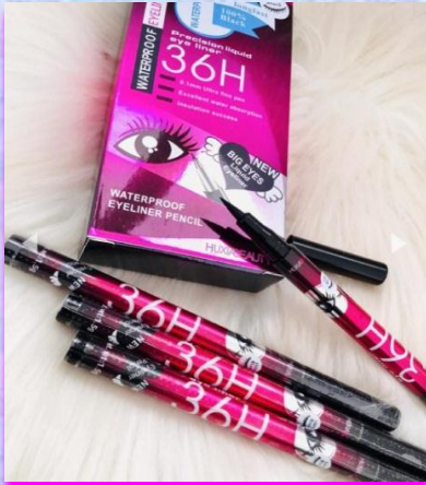
Delineador en plumón 36 H Seca en mate y es muy pigmentado, su aplicador es de fácil aplicación y precisión.