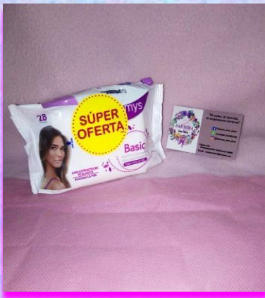
Toallitas Desmaquillantes Pomys x 28